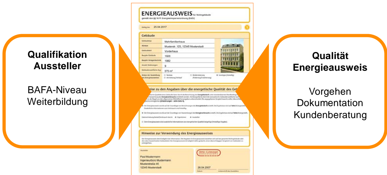
Abbildung 2: Zwei Säulen der Qualitätssicherung für Energieausweise mit dena-Gütesiegel

Konzept: Das dena-Gütesiegel für den Energieausweis